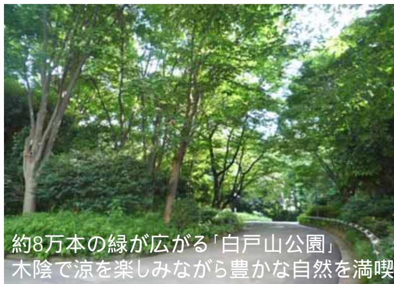
約8万本の緑が広がる「白戸山公園」 木陰で涼を楽しみながら豊かな自然を満喫